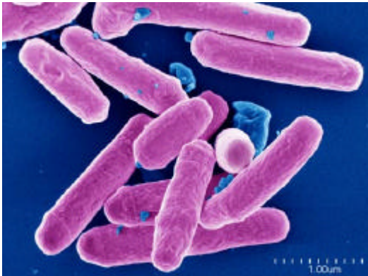
Figura 1: Mycobacterium avium