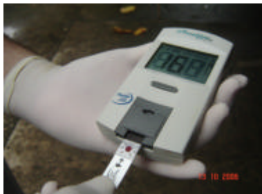
Figura 3: Colocação da fita reagente no aparelho