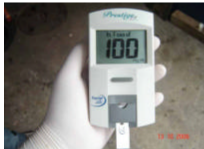
Figura 4: Leitura do valor da taxa de glicose