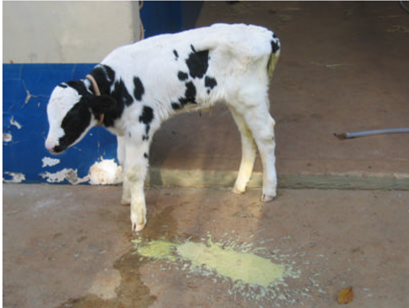
Figura 2. Diarréia moderada a grave (grau 2 – fezes líquidas) de bezerro infectado com 10^9 UFC de Salmonella Typhimurium, 24 horas após a inoculação.