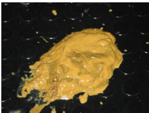
Figura 1. Diarreia discreta (grau 1 – fezes pastosas) de bezerro infectado com 10 9 UFC de Salmonella Typhimurium, 24 horas após a inoculação.

Os resultados permitem concluir que a administração oral de 10 9 UFC de Salmonella Typhimurium é eficiente para induzir quadro clínico experimental de salmonelose em bezerros com 10 a 15 dias de vida. Também, é possível afirmar que os principais sinais clínicos induzidos pela infecção incluem diarreia discreta a grave e hipertermia, contudo sem evidência de sinais sistêmicos.